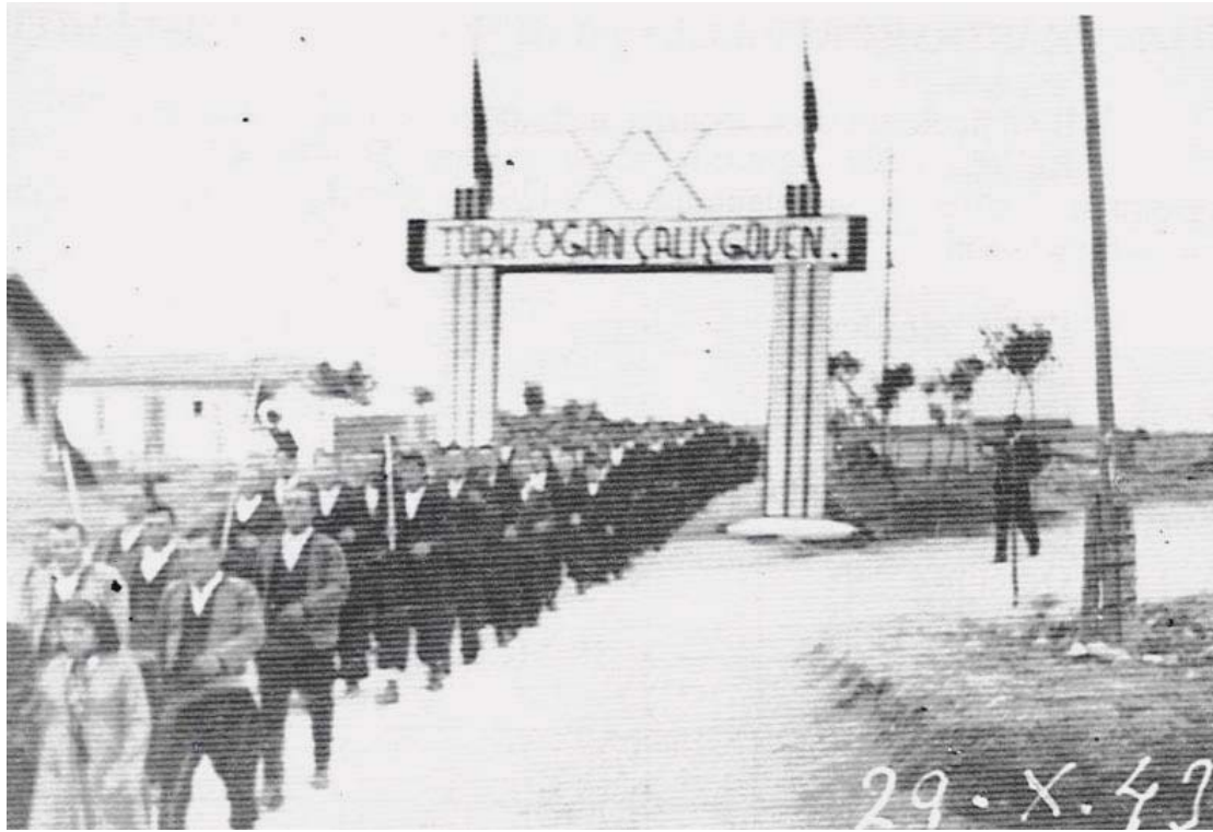
Göl Köy Enstitüsü, Cumhuriyet Bayramı kutlamaları, Kastamonu - 1943

Bir kez daha vurgulamak gerekirse, bazı detaylarda yapılacak eleştiriler, böyle büyük bir projenin değerini düşürmediği gibi, o günden bugüne, bir daha aynı büyüklükte bir "düşünce" ve "planlamaya" rastlayadığımızı, üzülen ifade etmek durumundayım. Ancak olumlu taraftan bakarsak, o günün zor koşullarında bunlar başarılabilirdiğine göre, bugün çok daha fazlasını neden başaramayalım, diye kendi kendime soruyorum. Köy Enstitüleri Projesi'nin günümüz koşullarına uyarlanmış probleme dayalı öğrenme modalarını başta üniversitelerimiz olmak üzere denemeye ne dersiniz!