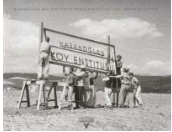
Hasanoğlu Köy Enstitüsü Ankara - Kayseri Demir Yolu, 35. km

Köy Enstitüleri'nde yaşam, dönemin öğretmen ve öğrencilerinin anlatımı ile tam "birliktelik, katılım, yetki" ve "sorumluluk"