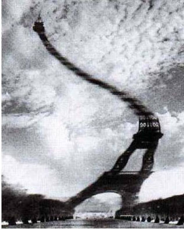
Robert Doisneau "Untitled"

Yaratıcılık bir süreçtir, eğitimle geliştirilebilir. Öğrenci çalışmaları izlenerek yaratıcılık süreci eğitilebilir. Önemli olan, olaylara, fikirlere, kurallara, davranışlara, nesnelere farklı bakmak ve değiştirmek istemektir. Yaratıcılık ayrıntının görülmesi ve birleştirilmesidir. Bu nedenle eğitim sürecinde yaratıcılık nefes almak gibi olmalıdır. Temel tasarım düşünebilmeyi ve düşünce, sezgi ürünlerini iletebilmeyi içerir. Ama hiçbir zaman unutmamak gerekir, Temel Tasarım yöntemleri deneyseldir. Temel Tasarım Sanat Eğitiminin alt yapısını oluştururken yaşam boyu sürecek anlamları içinde taşınmalıdır. Bu bağlamda sadece geleneksel biçimleri yinelemek yerine, çağın kültürünü yakalama yolu ile yaratıcılığa yer vermek gereklidir. Bu nedenle salt görüleni tekrarlamak ve kopya çalışmalarında kalmak zanaatsal tavrı geliştirir. Halbuki yaratıcılıkta; algı zenginleştirilmesi, bellek beslemesi, sezgisel tavrı geliştirici davranış biçimleri gereklidir.