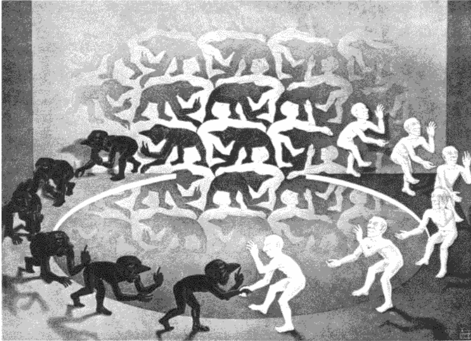
Encounter Escher (1944)